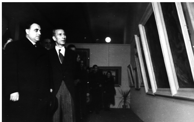
Б. Йоцов открива Общата художествена изложба в София – 26 декември 1943 г.