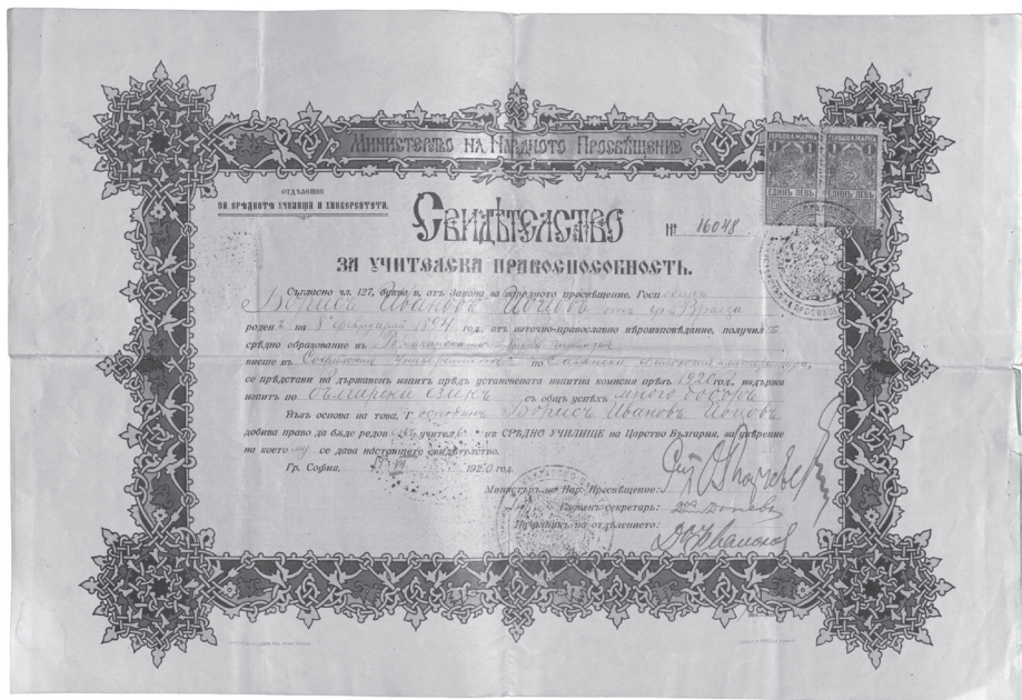
Свидетелство за учителска правоспособност с подписа на министър Стоян Омарчевски – 19 юли 1920 г.