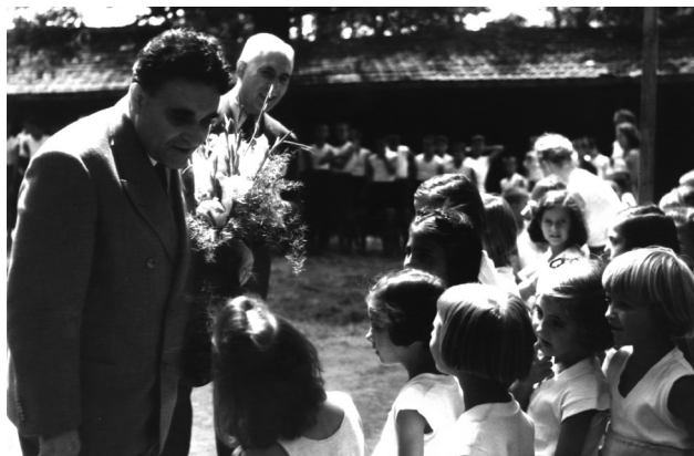
Б. Йоцов се среща с деца на игрище в София – юли 1943 г.