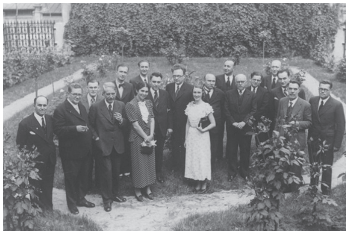
Снимка от гостуването на Роман Якобсон в София. В средата са Борис Йоцов и Роман Якобсон. На първия ред: Прокоп Макса (вторият отляво надясно), до него – проф. Ст. Романски, Л. Андрейчин (първият отляво надясно), до него – проф. Й. Иванов. Вдясно от Р. Якобсон е проф. Ст. Младенов. (Снимката е от НА на БАН ф. 130К, оп. 1, а.е. 336.)