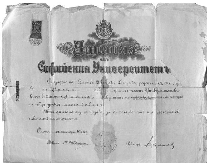
Диплома за завършен пълен университетски курс в Историко- филологическия факултет – 22 октомври 1919 г.