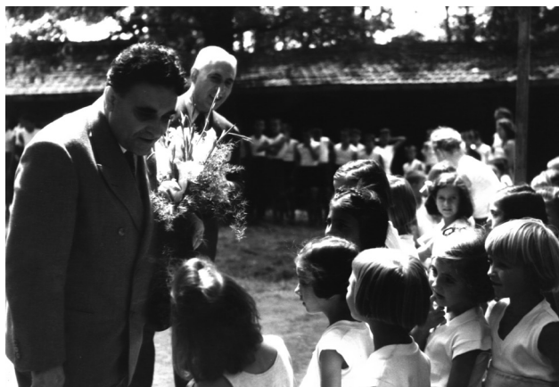
Б. Йоцов се среща с деца на игрище в София – юли 1943 г.