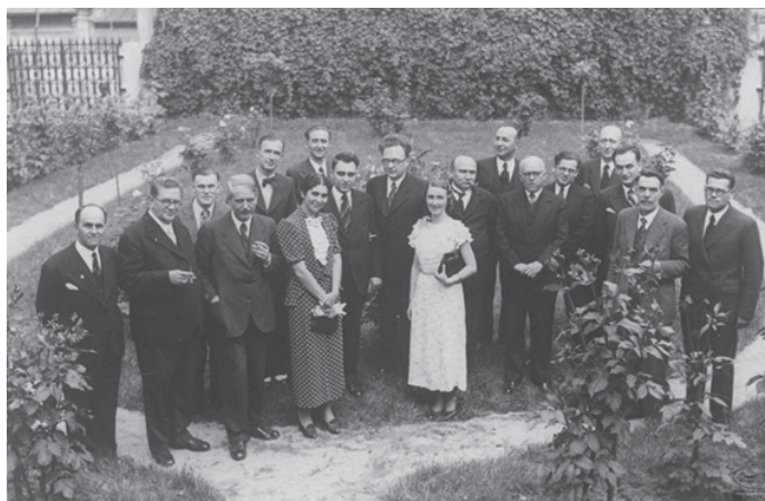
Снимка от гостуването на Роман Якобсон в София. В средата са Борис Йоцов и Роман Якобсон. На първия ред: Прокоп Макса (вторият отляво надясно), до него – проф. Ст. Романски, Л. Андрейчин (първият отляво надясно), до него – проф. И. Иванов. Вдясно от Р. Якобсон е проф. Ст. Младенов.