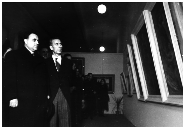
Б. Йоцов открива Общата художествена изложба в София – 26 декември 1943 г.